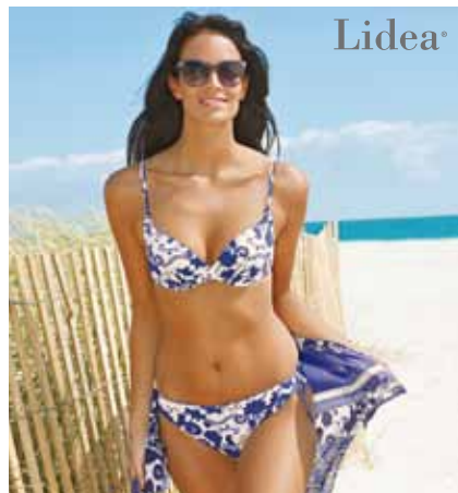
Aufregend neue Bikinimode von Lidea® in allen Cupgrössen.

Lidea trumpft mit einem überzeugenden Konzept von Bikinis und Badeanzügen. So startet jeder Ferientag mit einem neuen modischen Bekenntnis. Schnitte und Designs setzen den Rücken raffiniert in Szene. Neuartige Schnüreffekte an Höschchen und Ausschnitten sorgen für variable Stylingmöglichkeiten. Gürtel-effekte, Cut-outs